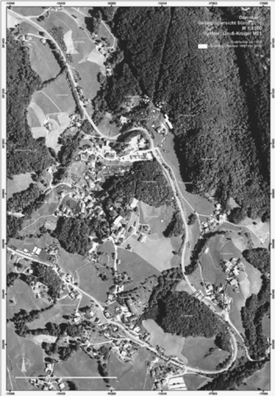
Die markierten Grabungsflächen verdeutlichen die Intensität der archäologischen Forschung auf dem Dürrnberg, die meist mit Notgrabungen auf die Gefährdung der urgeschichtlichen Relikte durch Baumaßnahmen reagieren muss Graphik: Dürrnbergforschung