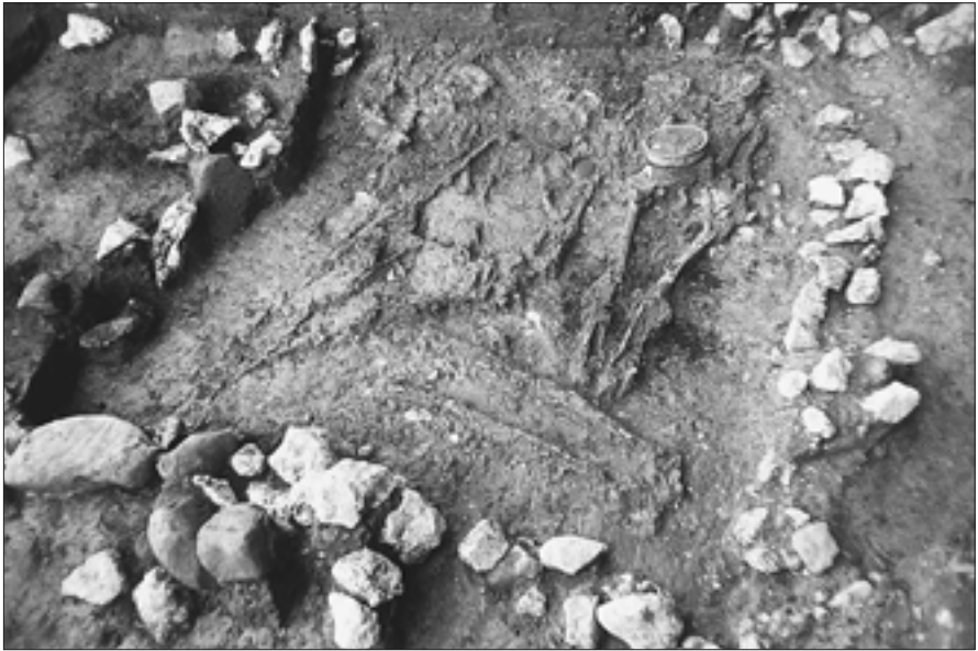
Die Skelette der nacheinander wie in einer Gruft in Grab 229#2 beigesetzten Individuen bedecken den gesamten Boden der Grabkammer