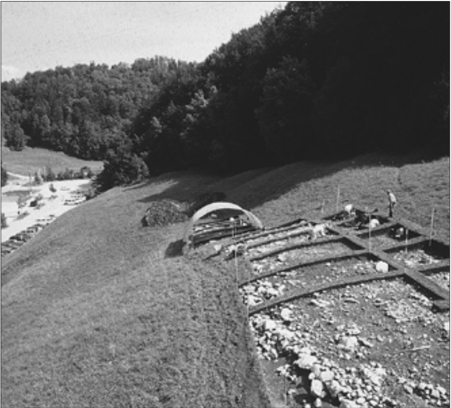
Die Ausgrabungen in der Flur „Hexenwandfeld“ brachten Siedlungs- und Grabreste zu Tage, die sich in der gewellten Oberfläche des Wiesengeländes auch obertägig abzeichnen.

maßlichen antiken Hauptzugangsweg, erreicht man das Südende des Ramsautales, in dem sich eines der Siedlungszentren des Dürrnberges konzentrierte. Von dieser Position öffnet sich - bei reduzierter Vegetation - der Blick nach links über einen Bacheinschnitt zu den gleichsam vor einer natürlichen Theaterkulisse angeordneten Gräbern. Es ist kaum vorstellbar, dass eine solche Inszenierung am „Berg der Ahnen“ dem Zufall geschuldet ist. Erst die umfassende Aufarbeitung und Neuverlage des Dürrnberger Gräberbestandes, dem sich die Dürrnbergforschung mit großer Initiative widmet,