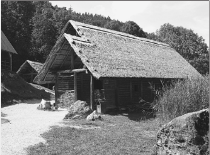
Rekonstruktion eines eisenzeitlichen Wohnhauses im Keltendorf SALINA auf dem Dürrnberg

ein, wobei bis heute unklar ist, woher die Initiative für diese Wirtschaftsmaßnahme kam - aus Kupferbergbaurevieren der Inneralpen oder aus Hallstatt selbst, wo ja schon seit der Bronzezeit unterirdisch Salz gewonnen wurde? Allerdings verwendeten die Hallstätter Bergknappen Bronzepickel, so dass offensichtlich kein Technologietransfer mit dem Dürrnberger Revier stattfand, in dem das typische eiserne Gezähe mit um die hölzerne Knieholmschäftung greifenden Schaftlappen zum Einsatz kam. Dieser markante technologische Unterschied liefert ein wichtiges Indiz für eine unterschiedliche Herkunft der Dürrnberger und Hallstätter Bergleute. Ob beide für die Salzversorgung ganz Mitteleuropas so wichtigen und so nah beieinanderliegenden Reviere in wirtschaftlicher Konkurrenz zueinander standen, wird allerdings nach wie vor diskutiert.