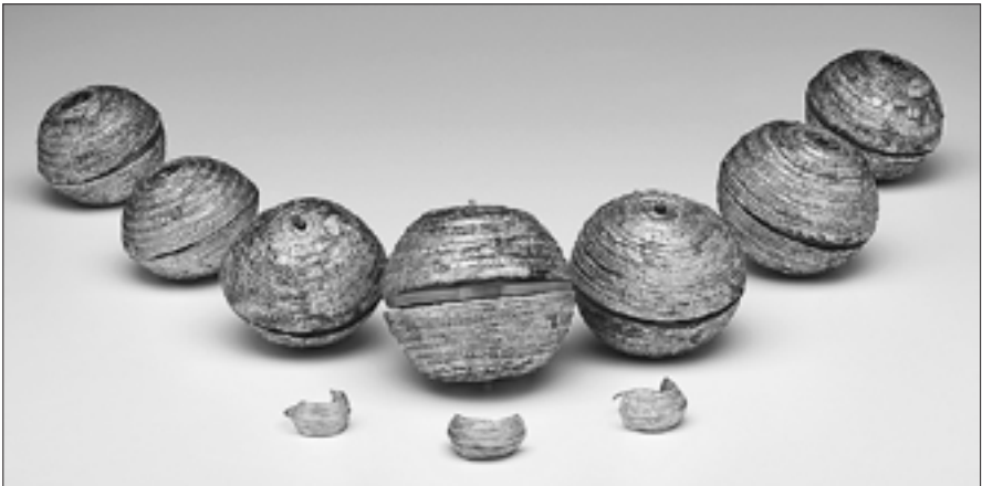
Die hauchdünnen Goldkugeln und massive Lockenringe aus Grab 353 zierten im 6. Jahrhundert v. Chr. Haube und Frisur einer hochstehenden Frau

stand am Dürrnberg fassbar, der sich in den reichen Grabbeigaben der Gräber 67 und 353 ausdrückt. Ein Bernsteinkollier schmückte die Tote aus Grab 67 und eine prunkvolle Haube die Frau aus dem späthallstattzeitlichen Grab 353. Jede der sieben hohlen Goldkugeln des Kopfschmuckes besteht aus feinstem Blech und wiegt gerade einmal 2 g. Wie die zugehörigen massiveren Lockenringe sind sie reich mit Punzen verziert, die ganz ähnlich auch auf kegelförmigen Hüten aus Birkenrinde auftauchen, in die konzentrische Muster eingeprägt waren. Entsprechende Hüte sind neben zwei Exemplaren vom Dürrnberg bislang nur von fünf weiteren Fundplätzen bekannt und könnten wie der filigrane Kopfschmuck der hallstattzeitlichen Frau Angehörigen der höchsten Gesellschaftsschicht vorbehalten gewesen sein. Neben den Beigaben, die mitunter mehr über den sozialen Status der Hinterbliebenen aussagen, die sie den Toten zuwies, können aus den individuellen Überresten, das heißt den menschlichen Knochen konkrete Informationen zur eisenzeitlichen Lebensrealität gewonnen werden.