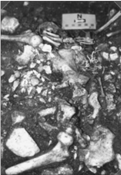
Die Frau aus Grab 308 starb, wie die in ihrem Beckenbereich gefundenen Skelettreste ihres ungeborenen Kindes nahelegen, an Geburtskomplikationen

Wie bereits ältere Untersuchungen zeigten, dienten zahlreiche Kammern dazu, mehrere Tote aufzunehmen und fungierten somit gewissermaßen als Gruft. Entgegen ursprünglicher Annahmen, es handle sich um Massengräber, zeigt sich, dass die Verstorbenen sukzessive in den offenbar für mehrere Bestattungsvorgänge zugänglichen Kammern niedergelegt wurden. In Grab 192#2 der Nekropole am Römersteig fanden sich in einer einzigen Grabkammer Reste von 16 Individuen. Nicht nur hier waren die Skelettreste im Zuge nachfolgender Bestattungszereemonien mehr oder weniger sorgfältig an den Rand der Kammer verschoben worden, um Platz für die neuerliche Aufnahme eines Toten zu schaffen. Die Knochen wurden hierzu häufig zu regelrechten Paketen gebündelt oder ungeordnet dis-